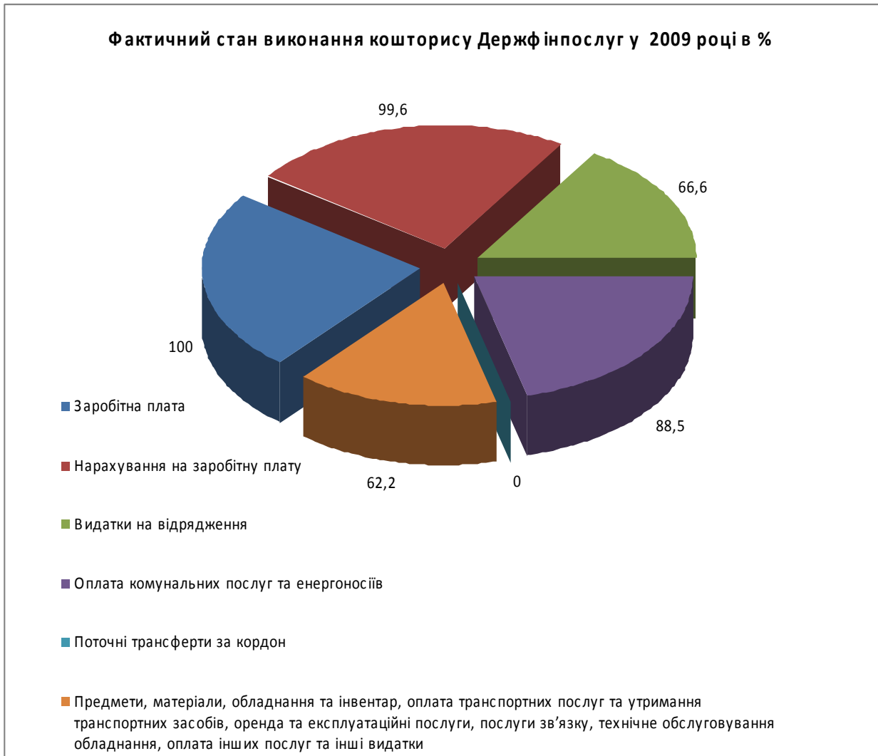
Рис. 2. Фактичний стан виконання кошторису Держфінпослуг у 2009 р.

Діяльність Держфінпослуг в 2009 році здійснювалася в умовах жорстких бюджетних обмежень. Стан виконання кошторису показано на рисунку 2.